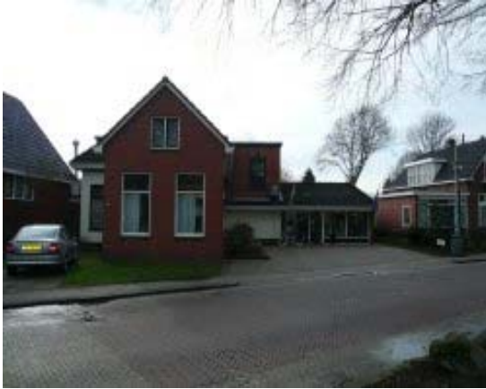
vooraanzicht van het pand